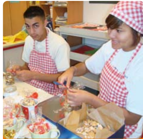
CaBosch Catering Carl-Bosch-Schule

Einmal mehr stellen wir euch in der NEBS-WELT einige der inzwischen über 250. Schülerfirmen des NEBS kurz vor. Natürlich könnt ihr uns auch eure Porträts zusenden und uns erzählen, wie ihr in eurer Schülerfirma arbeitet. Einfach per Mail an nebs-welt@asig-berlin.de und vielleicht ist eure Schülerfirma dann schon in der nächsten Ausgabe der NEBS-WELT dabei.