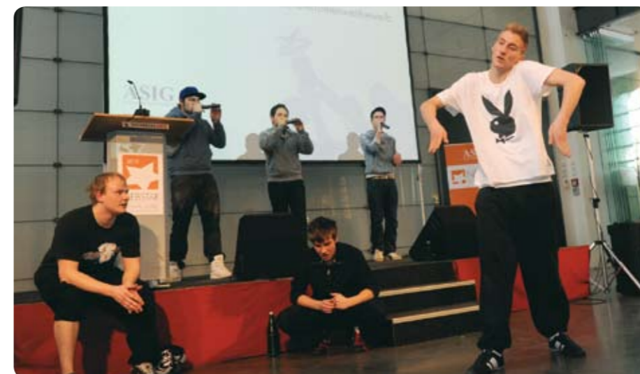
Die Beatboxer „Oralic Soundmachines“ und die Breakdancer „Rumble Pack“ sorgten für Unterhaltung vor der Preisverleihung