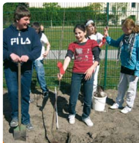
Kraut & Rüben Schule am Zillepark

Zum Aufgabenbereich von „Kraut & Rüben“ gehören außerdem die Pflanzenpflege in der Schule, das Beschneiden der Sträucher im Umfeld des Schulgebäudes und das Zusammenharken von Laub im Herbst. In den Wintermonaten werden Gestecke gefertigt, die auf Basaren verkauft werden, Fotos von der Gartenarbeit am Computer bearbeitet, wird Pflanzenkunde betrieben oder z.B. über das Berufsbild des Gärtners bzw. der im Gartenbau Beschäftigten gesprochen.