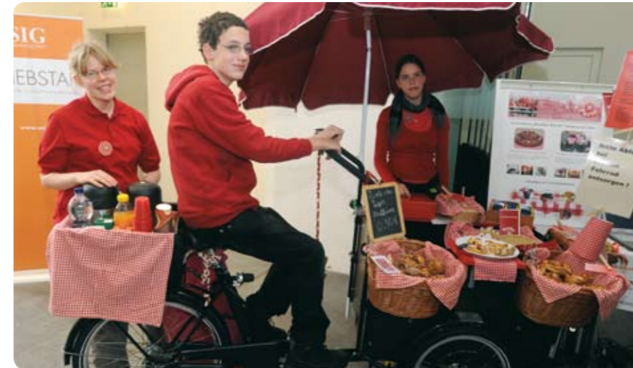
Trotz Schneesturm kam die Schülerfirma „Panke-Perle“ der Panke-Schule mit Ihrem Verkaufsfahrrad zum NEBSTAR

Für alle, die den NEBSTAR 2010 noch einmal in bewegten Bildern erleben möchten, sei an dieser Stelle auf die eifrigen Filmemacher der Schülerfirma „manomedia“ von der Prignitz-Schule verwiesen. Für ihre Filmdokumentation wurden sie außerdem mit einem Sonderpreis geehrt. 🌐