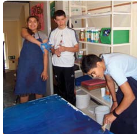
Wartburg Painters Wartburg-Schule

Seit dem neuen Schuljahr gibt es an der Wartburgschule auch eine Schülerfirma im künstlerischen Bereich. Die kreativen Jugendlichen verfolgen dabei einen ehrgeizigen Plan: